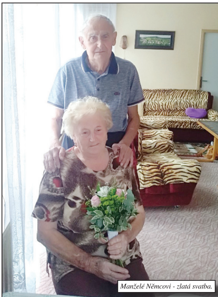
Manželé Němcovi - zlatá svatba.