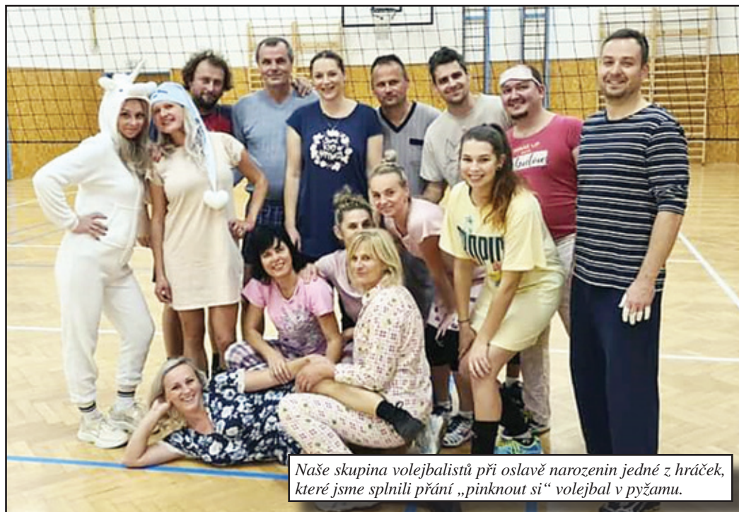
Naše skupina volejbalistů při oslavě narozenin jedné z hráček, které jsme splnili přání „pinknout si“ volejbal v pyžamu.

Již druhá soutěžní sezona volejbalistek zůstala jen ve stadiu plánování utkání okresního přeboru, covidová epidemie zabránila jak dohrát ročník 2019/2020, tak i vůbec začít ročník 2020/2021. Také pravidelná setkávání pod vysokou sítí i letos podléhala tomu, jaké zrovna bylo vyhlášeno opatření. Chyběl nám nejen pravidelný pohyb, ale i kontakt s kamarády, probírání novinek ze života a taktéž legrácky, s kolektivním sportem spojené. Až během května jsme se mohli společně setkat na venkovním hřišti u školy a následně i v tělocvičně. Celé léto až do poloviny září jsme docházeli na antukové hřiště a opatrně začínali plánovat další aktivity volejbalové i společenské. Někdy se nás sešlo i 14, bylo znát, že volejbal opravdu mnoha lidem chyběl. Ani podzimní měsíce nás neodradily od sportu a v tělocvičně se scházíme opět v hojném počtu. Sice převahu už mají muži, ale my ženy jsme rády, že je nás na běhání po hřišti více. Naši „starou nízkou tělocvičnu“ si pochvalují