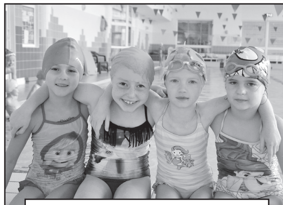
Na plavání do Vsetína jezdí každoročně všichni žáci první, druhé i třetí třídy.