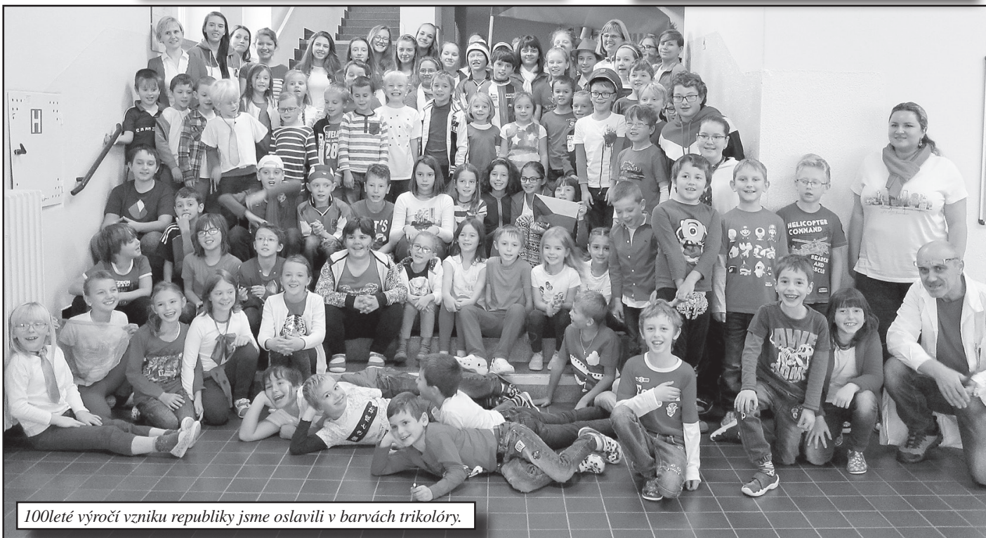
100leté výročí vzniku republiky jsme oslavili v barvách trikolóry.