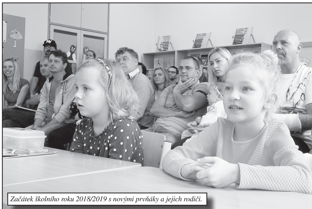
Začátek školního roku 2018/2019 s novými prvňáky a jejich rodiči.

Žákům jsme zpříjemnili nástup do školy dvěma dny sportovních aktivit na školním a fotbalovém hřišti. Vstupní písemné (neznámované) prověrky pomohly vyučujícím zjistit, co si žáci zapamatovali z předchozích ročníků a co je potřeba ještě zopakovat. V průběhu prvního čtvrtletí školního roku proběhlo testování znalostí žáků 9. třídy formou SCIO testů.