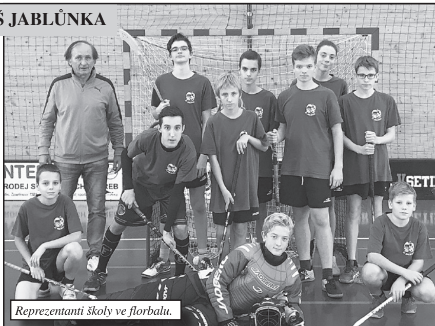
Reprezentanti školy ve florbalu.