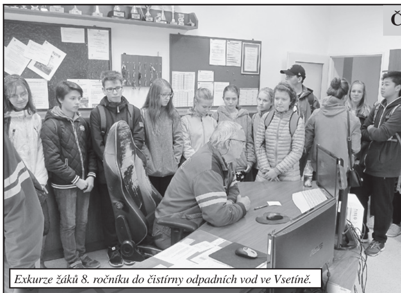
Exkurze žáků 8. ročníku do čistírny odpadních vod ve Vsetíně.