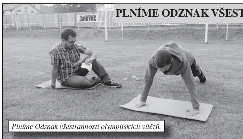
Plníme Odznak všestrannosti olympijských vítězů.

Ve dnech 6. a 7. září 2017 jsme plnili „Odznak všestrannosti olympijských vítězů“. Téměř všichni žáci školy postupně vyzkoušeli několik různých sportovních disciplín, např. běh na 60 m a 1 000 m, trojskok snožmo, hod míčkem, kliky, lehy-sedy a další. Každý výkon byl pečlivě zaznamenán rozhodčími. Minuty, sekundy, metry, centimetry pak byly převedeny