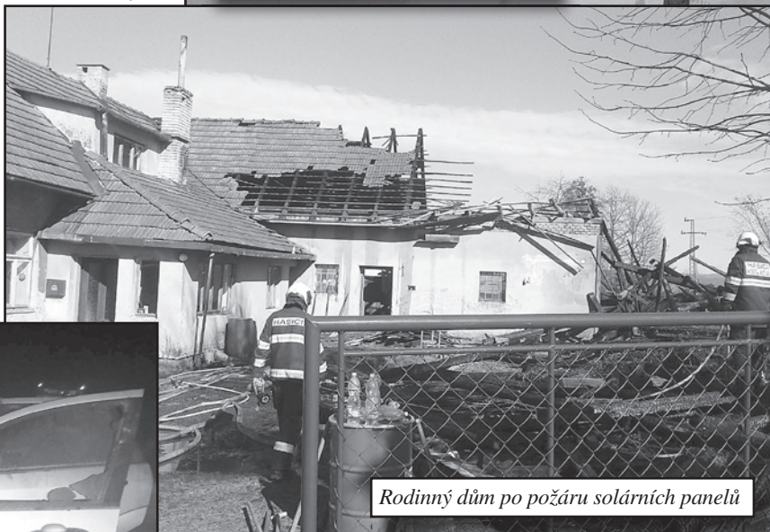
Rodinný dům po požáru solárních panelů