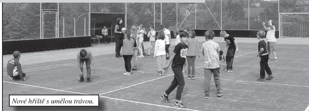
Nové hřiště s umělou trávou.

musíme hrát vybíjenou a fotbal na trávě.