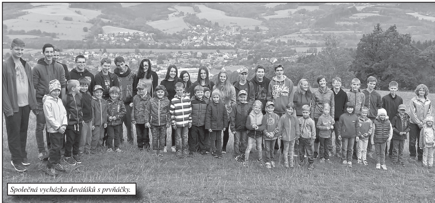
Společná vycházka devátáků s prvňáčky.