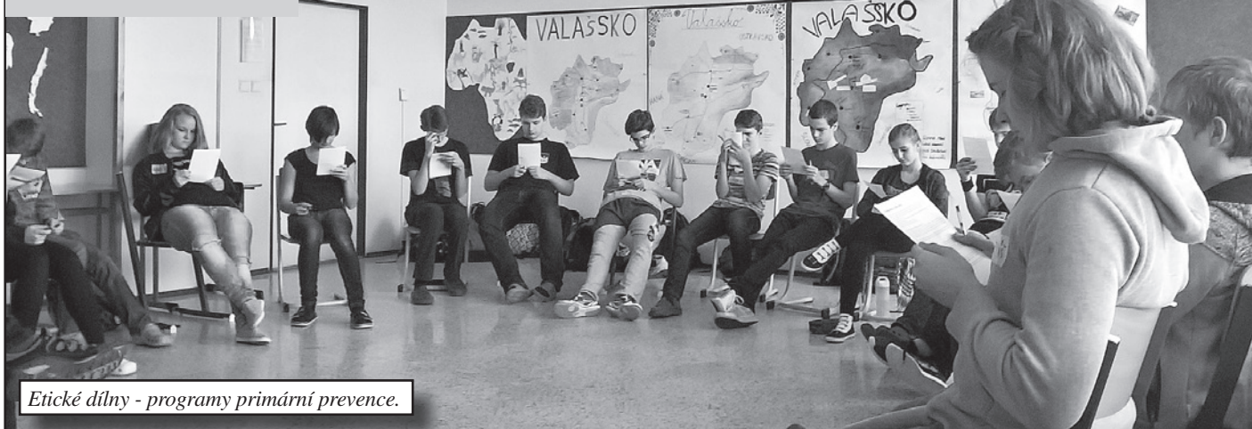
Etické dílny - programy primární prevence.

Ve čtvrtek 19. října proběhly na naší škole první preventivní programy v tento školní rok. Ve čtvr-