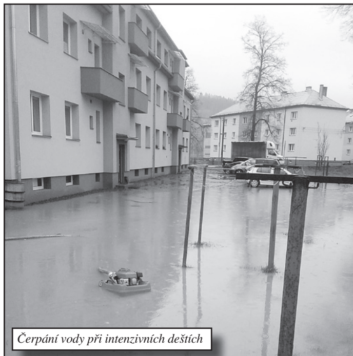
Čerpání vody při intenzivních deštích

Opakovaně se také snažíme oslovovat místní i okolní firmy a živnostníky, které žádáme o finanční podporu pro naši činnost. Tato snaha se nám zatím moc nedaří, většina žádostí se nám vrací s nepořízenou, nebo