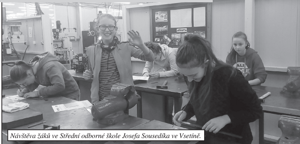
Návštěva žáků ve Střední odborné škole Josefa Sousedíka ve Vsetíně.

V rámci budoucí volby povolání navštívili 24. 10. 2017 žáci 7. ročníku odborná pracoviště Střední odborné školy Josefa Sousedíka ve Vsetíně. V restauraci Bečva, kde probíhá praxe výučních oborů cukrář, kuchař a číšník, připravili učitelé odborného výcviku a studenti pro polovinu naší sedmé třídy čtyřhodinový program plný praktických aktivit. Nejprve jsme měli možnost naučit se různé techniky skládání ubrousků a seznámili jsme se se správně založenou slavnostní tabulí. Následovala kuchařská část, a to příprava bramboráků. V poslední části jsme si vyzkoušeli práci cukrářů, modelovali jsme marcipánová zvířátka a zdobili vánoční perníčky pod vedením šikovných učnic. Žáci se dozvěděli, jak probíhá výuka v těchto oborech, jaké mají studenti možnosti, co je náplní oborů apod.