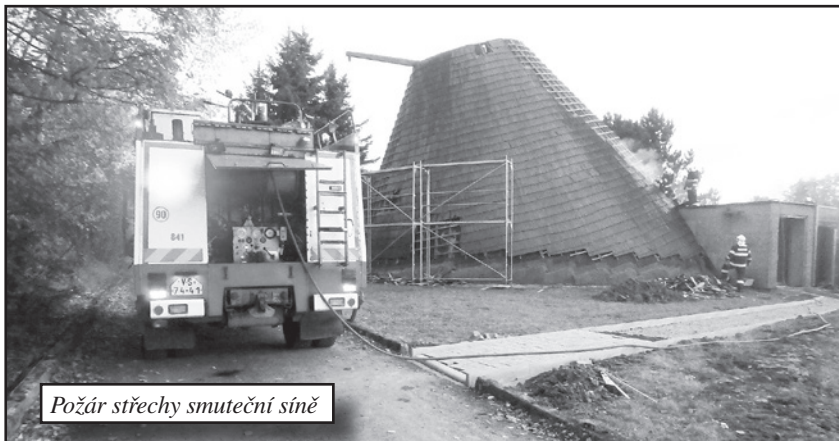
Požár střechy smuteční síně

naše jednotka také u dvou požárů v obci. Díky včasnému nahlášení občanů na tísňovou linku a rychlému zásahu naší jednotky byly požáry fotbalové tribuny na hřišti FK Jablůnka a požár smuteční síně rychle zlikvidovány, a tak uchráněny od větších škod.