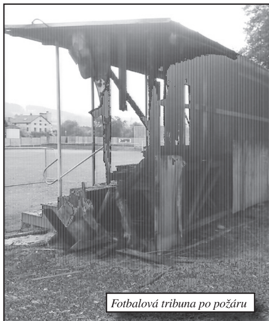
Fotbalová tribuna po požáru

Dále v obci jsme vypomáhali také na žádost starosty obce hlavně u čištění kanalizace, cest a koryt, při odstraňování nebezpečného hmyzu a přípravě ledové plochy za obecním úřadem.