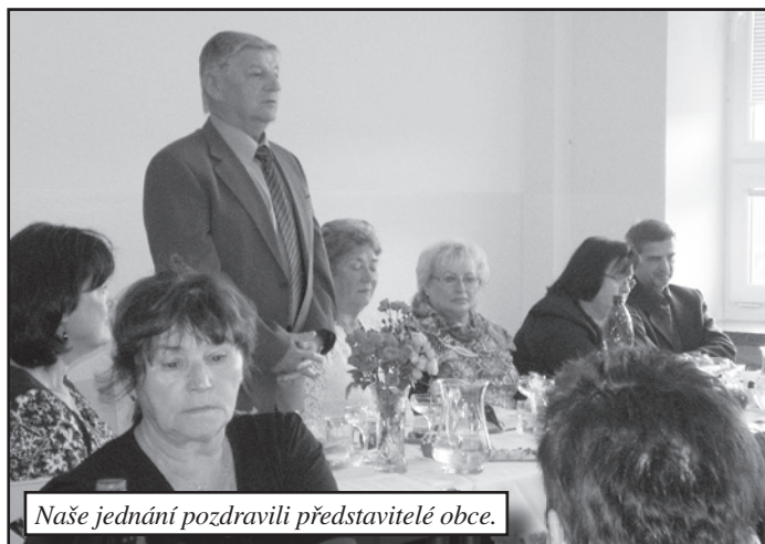
Naše jednání pozdravili představitelé obce.