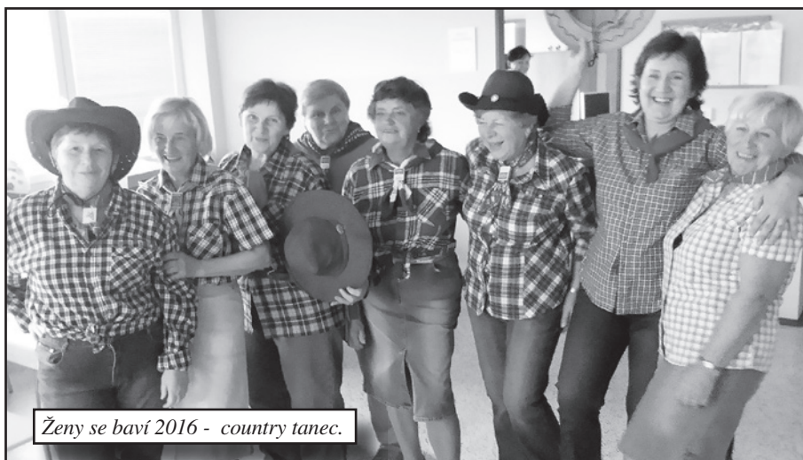
Ženy se baví 2016 - country tanec.

Největší akcí roku 2016 se pro nás stalo pořádání Okresní konference žen a zábavného odpoledne Ženy se baví. Pro hosty byl připraven bohatý program, zaháje-