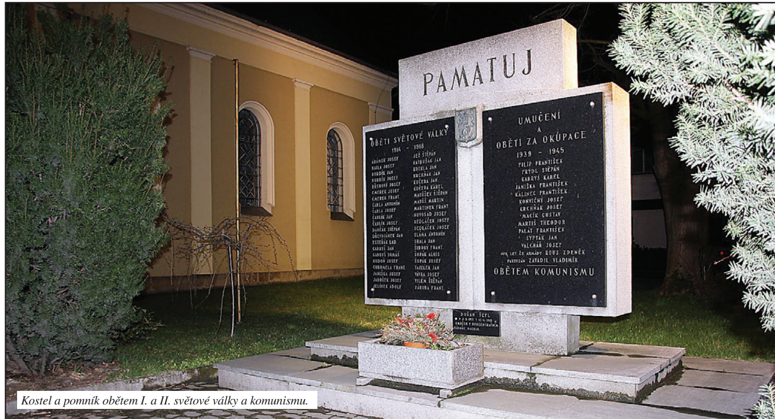
Kostel a pomník obětem I. a II. světové války a komunismu.