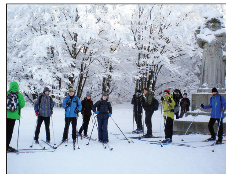
Jablůnecký zpravodaj - strana 7

tevnách. Měli jsme štěstí na slušné počasí a výborné sněhové podmínky. Žáci 6. až 9. třídy dělali svým lyžařským instruktorem z řad učitelů a rodičů radost. Domů jsme se vraceli vždy příjemně unavení, ale dobře naladěni a bohatší o společné zážitky spojené s pohybem a pohybem v nádherné zimní přírodě. ZŠ Jablůnka