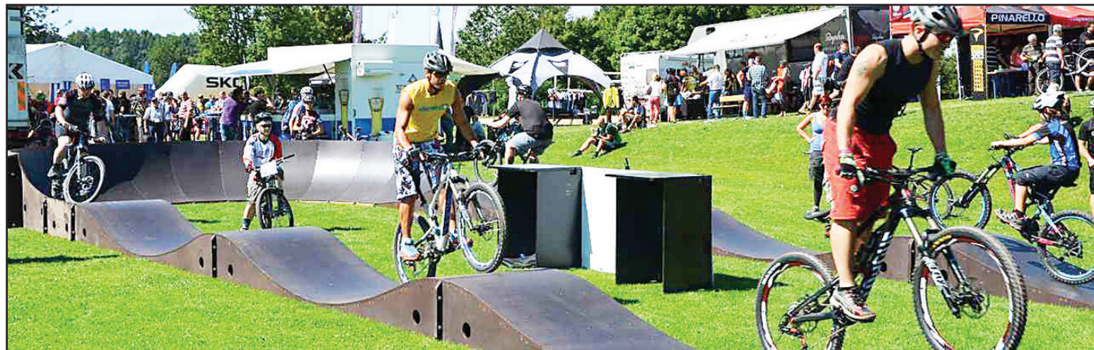
Jablůnecký zpravodaj - strana 6