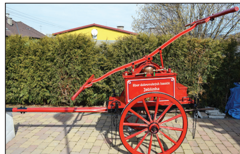
Jablůnecký zpravodaj - strana 10