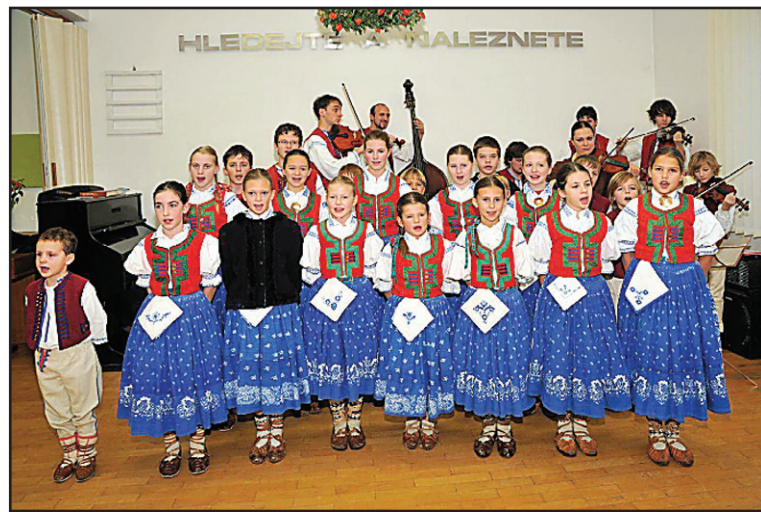
odkaz: Diplomová práce - Martin Tomešek - anonymizovaná.pdf). Je také možno nalézt tyto souhrnné informace v knižní podobě v Základní knihovně v Jablůnce. M. Tomešek, kazatel

V únoru pak měla široká veřejnost možnost navštívit přednášku o historii našeho sboru; přednáška byla rozdělena do dvou chronologicky navazujících částí (I. část: 18.–19. stol., II. část 20. stol.). Snad proto, že sál sborového domu nepraskal ve švech, měli prakticky všichni možnost dostat slovo v následné diskuzi. Přednáška čerpala z dat projektu s názvem: Historie Farního sboru Českobratrské církve evangelické v Jablůnce v 18.–20. stol. Proto případně zájemce mohou odkázat na jeden z výstupů této práce (vč. mnohých faktografických odkazů) na internetovém odkazu: https://wstag.jcu.cz/portal/prohlizeni/index.jsp (zde je třeba ve spodní části stránky otevřít