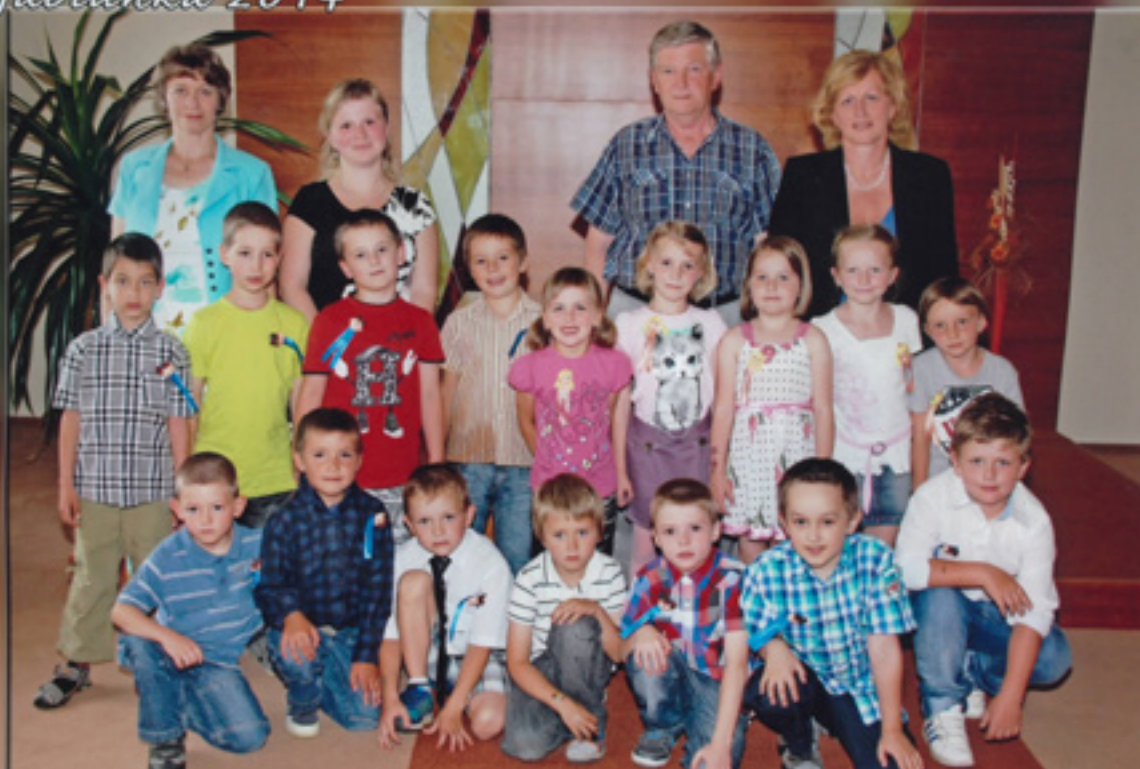
Rozloučení dětí z mateřskou školou v roce 2014.