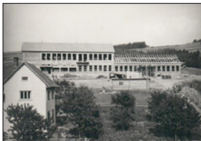
Rozestavěná budova Horní školy na počátku padesátých let minulého století

Tolik úryvek ze školní kroniky. K výstavbě nové školní budovy došlo však o mnoho let později. O složitých jednáních předcházejících výstavbě nové školy a o dalších zajímavostech z její historie se dozvíte v dubnu 2014 na besedě, která proběhne v prostorách bývalé Dolní školy, dnešního Obecního úřadu Jablůnka.