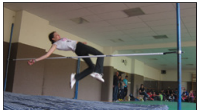
Každoroční soutěž ve skoku vysokém „Školní latka“.