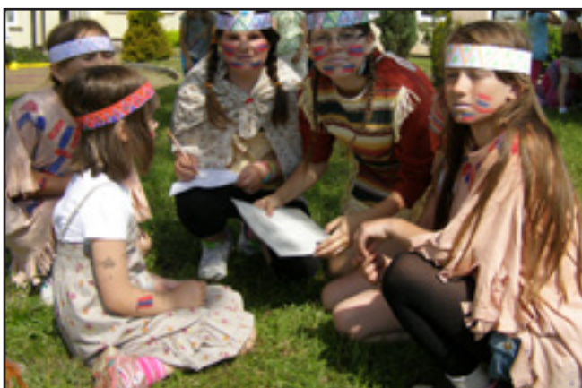
Vícedenní projekt „Indiáni“ na 1. stupni – čtení příběhů, výroba náhrdelníků, kreslení indiánských vesnic...