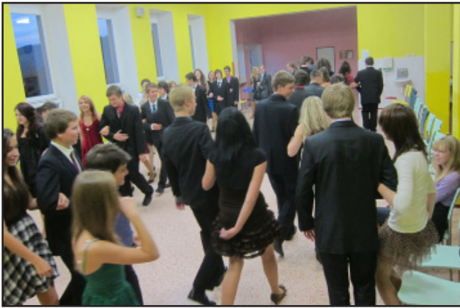
25 párů v kurzu předtaneční a společenské výchovy