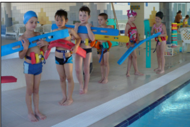
Kurz plavecké a předplavecké výuky v 1. – 3. ročníku