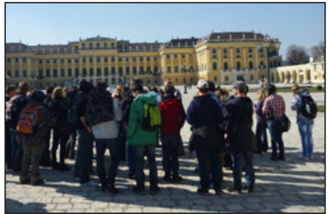
Poznávací exkurze do Vídně