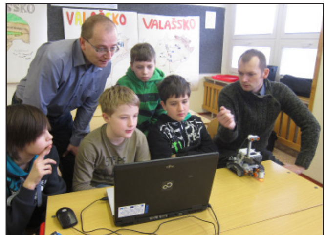
Základy robotiky pod odborným dohledem pracovníků hvězdárny ve Valašském Meziříčí