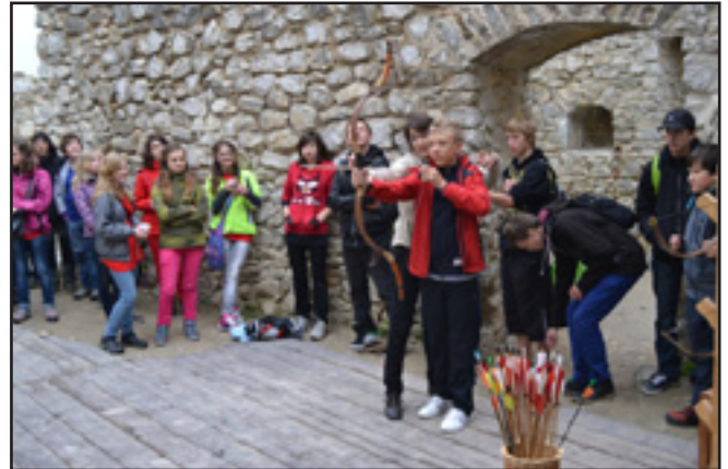
hradě Beckov v rámci partnerského setkání se slovenskou školou ve Svinné.