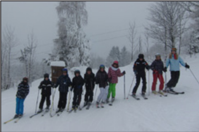
Lýžařský výcvik sjezdařů ve Velkých Karlovicích.