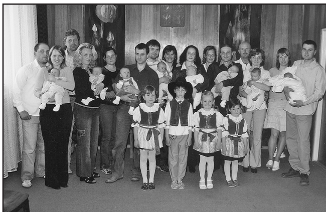
Vítání občánků 23. 4. 2007