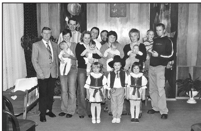
Vítání občánků 19. 11. 2007